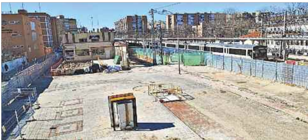
En la reunión con Adif también se solicitará información por la avería en las escaleras mecánicas de la estación de tren de La Garena