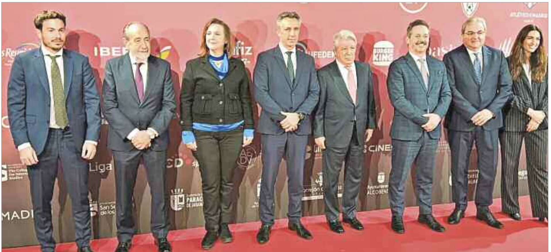
La MadCup, cuyo acto de inauguración del torneo tuvo lugar en el Estadio Cívitas Metropolitano, se celebrará en Madrid por cuarta vez entre los días 21 y 26 de junio