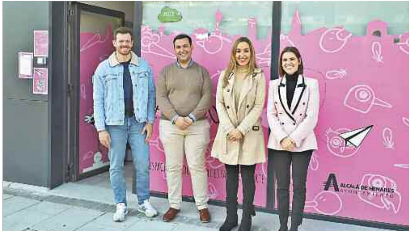
Cada semana se podrán encontrar con distintos aprendizajes como Canciones y Ritmos también podrán aprender Juegos de Movimiento, realizar Talleres creativos con materiales sencillos que pueden encontrar por casa y a contar Cuentos cantados, manipulativos, sensoriales.

El espacio ha entrado en funcionamiento este lunes, 19 de febrero y se han completado todos los grupos. Los últimos viernes de cada mes se abrirá de