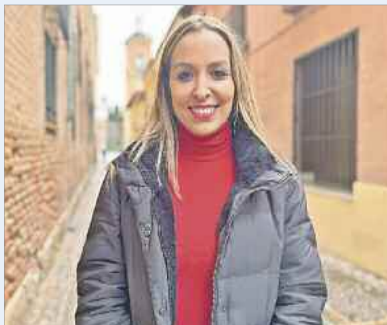
El objetivo de estos campamentos es ofrecer la posibilidad a los niños y a las niñas de Alcalá de Henares de que puedan disfrutar de un período vacaciones

"Así como promover diferentes valores o hábitos además de promover la iniciación o que puedan perfeccionar en actividades acuáticas, actividades físico-deportivas, manuales y también actuales intelectuales, y por supuesto, que puedan