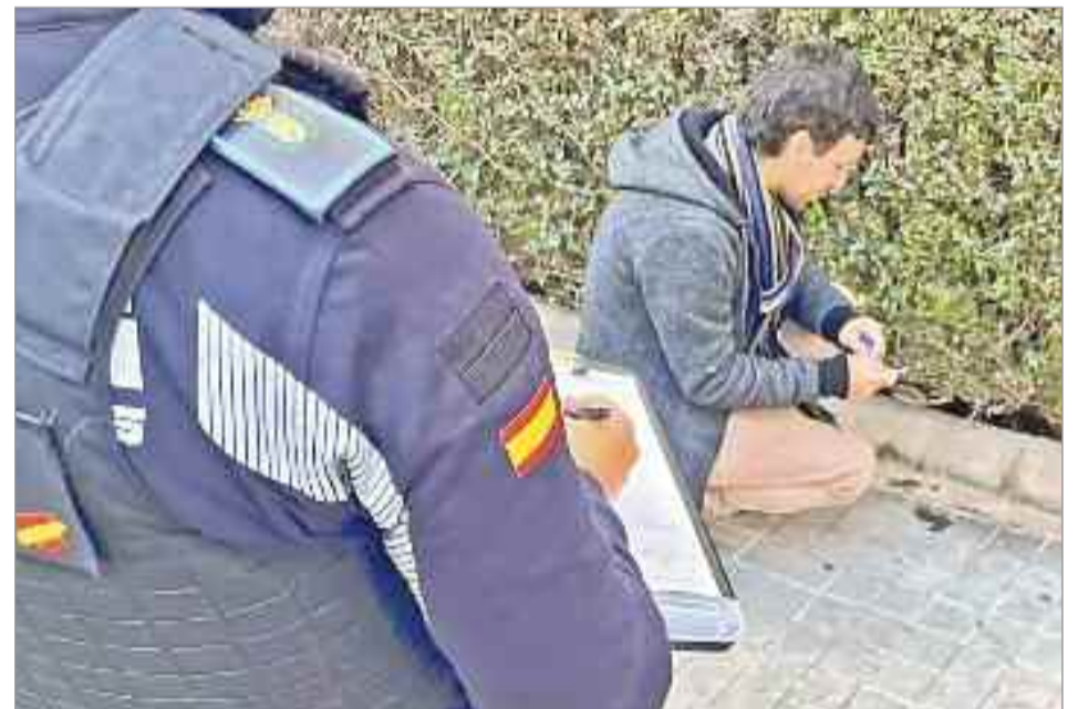
Hay que destacar también la campaña informativa que está realizando la Policía Local en las calles desde el pasado mes de octubre dirigida a una tenencia responsable de animales de compañía (control censo ADN, limpieza micciones con agua, etc.).

de mascotas que no han recogido las heces de los animales en distintos puntos de la ciudad, lo que constituye una infracción de carácter leve a la normativa municipal, pudiendo imponerse sanciones de entre 300 y 3.000 euros. Por otra parte, no inscribir al animal en el censo municipal obligatorio por ADN, también constituye una infracción leve de la referida ordenanza municipal, con idénticas sanciones. En febrero de 2024 ya se encuentran